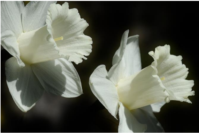
Een witte trompetnarcis als symbool om het goede nieuws van Pasen rond te bazuinen.